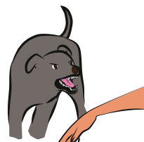
TENTE DE MORDRE